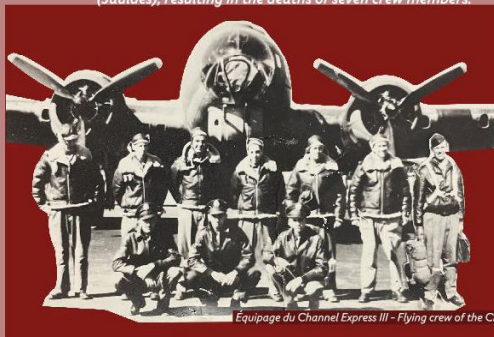
Equipage du Channel Express III - Flying crew of the Channel Express III

At 5:15 am, thirteen days after the Normandy Landings, the B17-G bomber Channel Express III took off from Deenethorpe Air Base (England) with ten American airmen on board, assigned to bomb the Bordeaux airfield. Near 9:30 am, the aircraft left formation and exploded mid-flight: the front section crashed at Font Perron (Aussac-Vadalle), the rear at the Trogniot site (Jauldes), resulting in the deaths of seven crew members.