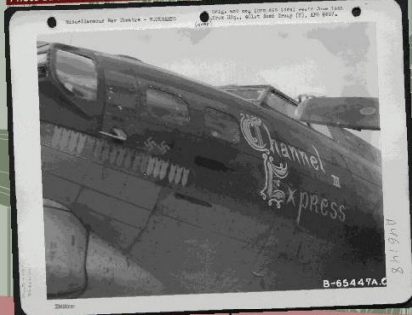
Photo du bombardier B17-G Channel Express III / Photo of the B17-G Channel Express III